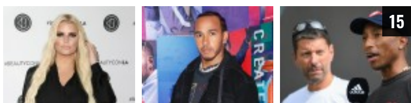
Diese Stars machen Mode: Ria Ora, Lewis

Aktive Modeunternehmer, die ihr Fach gewechselt haben, gibt es einige, auch wenn sie hierzulande nicht präsent sind. Da sind die Kinderstars Olsen-Twins, Mary-Kate und Ashley, mit ihren erfolgreichen Marken "The Row" und "Elisabeth and James", nett und ambitioniert. Da ist Jessica Simpson (39), bekannt aus "Twilight Zone", die ältere Schwester von Ashlee Simpson. Beide Pop-Sternchen und Schauspielerinnen. Sie ist wohl eine der erfolgreichsten Gründerinnen im Fashion-Bereich. Eine Milliarde Dollar Umsatz seit ihrer Gründung 2006. Jährlich.